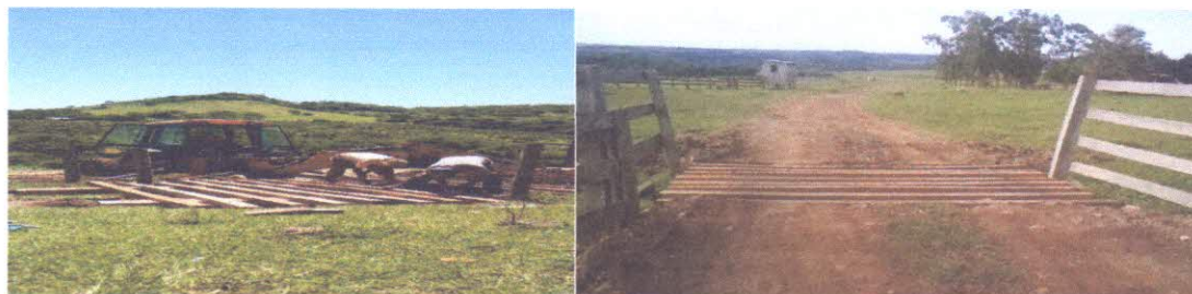
Foto da fabricação e manutenção de Mata Burros.