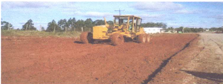
Foto da manutenção das vias urbanas e rurais.

A Secretaria Municipal de Obras, Viação, Serviços Públicos e Trânsito têm suas atividades diretamente ligadas ao cotidiano dos munícipes, através das ações diárias no atendimento e encaminhamento de soluções para melhoria do bem estar da população, quanto ao transporte, pavimentação, esgoto pluvial, iluminação, limpeza pública, manutenção da praça, cemitério e edificações de uso comum da população. Cabe destacar como principal ação a conservação de mais de 1.500 km de estradas vicinais que compõem a malha viária do município, realizando atividades de encascalhamentos em diversas localidades do município, colocação de bueiros, patrolamento, alargamento de estradas e rebaixamento de subidas, bem como roçadas em beira de estradas.